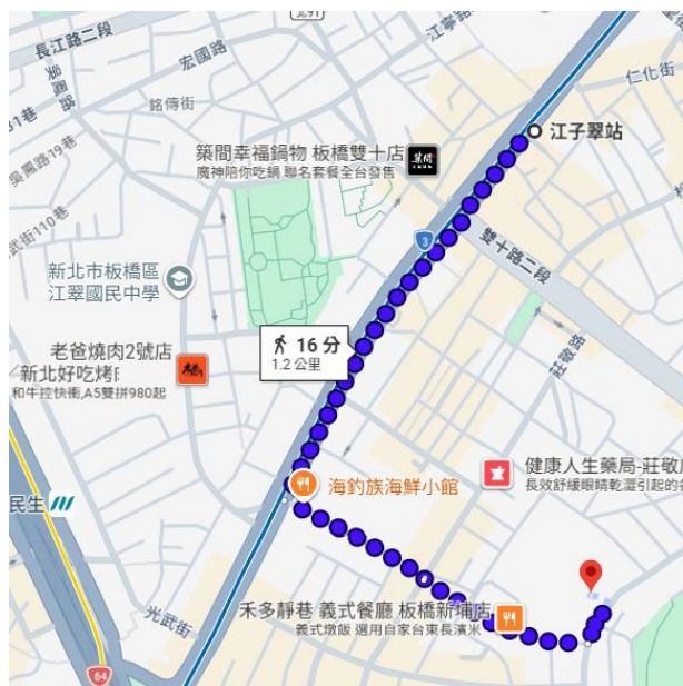
板南線/江子翠站捷運3號出口